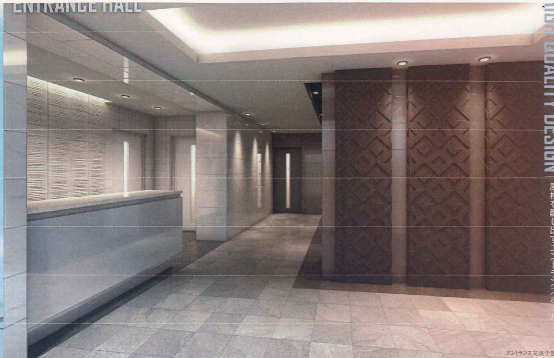
エントランス完成予想図